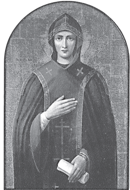
Святая Анна Кашинская

Двадцать второго декабря 1317 года в 40 верстах от Твери при селе Бортенева произошла битва.