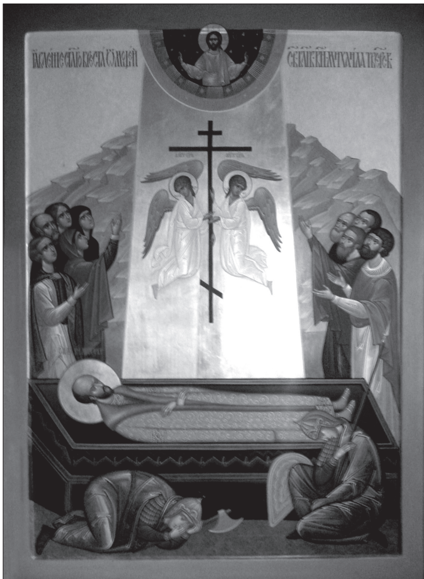
Маджарское чудо: явление огненного столпа над мощами Святого

предложениями, то Юрий убил его и по совету Кавгадыя поехал в Орду со многими князьями, боярами и новгородцами.